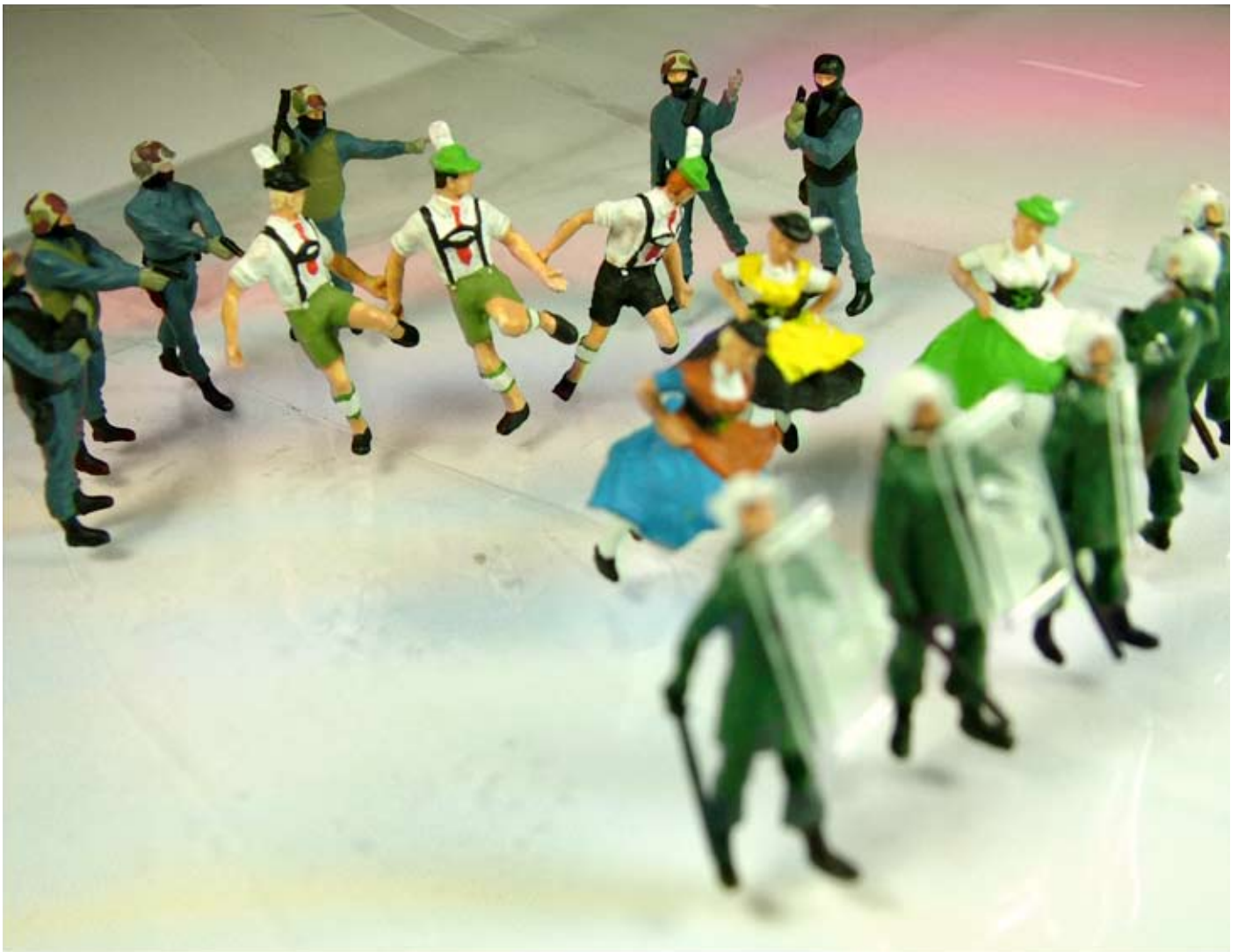
Pit Kinzer / Christian Kuntner „Gerngroß Models: Willkommen im Reisezentrum“, Entwurf für eine interaktive Raum-Klang-Installation 4 Pit Kinzer „Gerngroß Models: Unverhältnismäßiger Einsatz gegen vermeintliche Extremisten“, Fotoarbeit, 170 x 130 cm