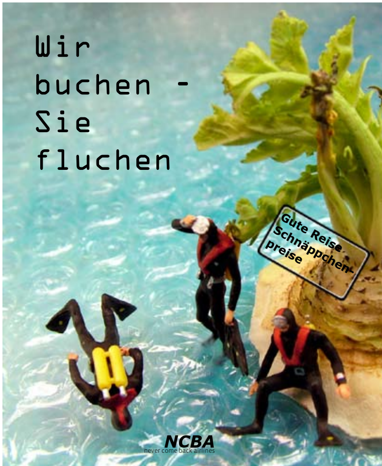
Plakat, Fotoarbeit auf Papier, ca. 70 x 100 cm