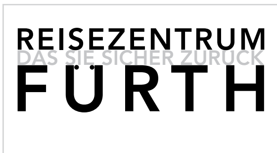
„Firmen“-Schild, Acrylglas, ca. 40 x 20 cm