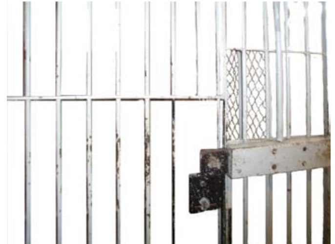
Bildtafel 1 „Blasmusiker“, ca. 110 x 160 cm / Bildtafel 3 „Schuhplattler“, ca. 110 x 170 cm Bildtafel 2 „Dirndl von unten“, ca. 100 x 100 cm / Bildtafel 4 „Gitter“, ca. 120 x 100 cm Fotoarbeiten auf Acrylglas