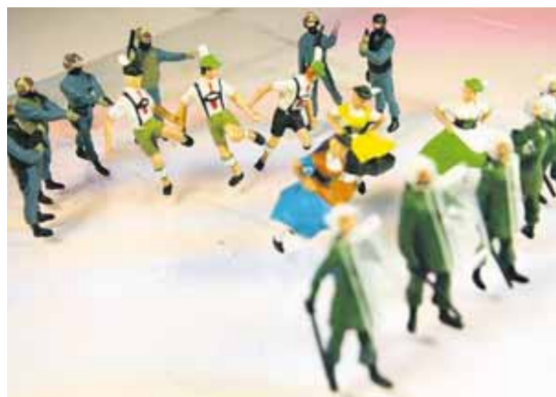
Und das ist eines von vielen hundert Ergebnissen der Arbeit mit den „Gerngroß Models“. Titel: „Unverhältnismäßiger Einsatz gegen vermeintliche Extremisten“.

Jüngst hat Pit Kinzer einen Katalog zu den Gerngroß Models (7 Euro) herausgebracht. Zu bestellen per E-Mail unter kunstprojekte@pitkinzer.de www.pitkinzer.de